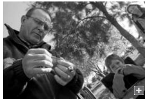
Un hombre procede al anillamiento de un ave en el parque del Torrejón del Rinconcillo.

El Colectivo Ornitológico Cigüeña Negra (Cocn), dentro de la iniciativa Volcam, ha organizado para los próximos meses de septiembre y octubre multitud de actividades de voluntariado con el objeto de dar a conocer los valores ambientales del Parque Metropolitano del Torrejón, situado en la barriada de El Rinconcillo, donde se ubica un observatorio de aves del río Palmones.