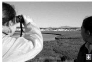
Imagen de archivo de dos niñas observando las aves junto a las marismas del parque de El Torrejón.

El Parque El Torrejón por su ubicación cercana al núcleo urbano algecireño, además de su orientación hacia las marismas se ha convertido en una herramienta fundamental para transmitir los valores medioambientales adecuados. Desde él se pueden realizar diversas actividades que tengan como objetivos la puesta en valor de este espacio natural.