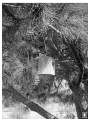
Una caja nido colgada por Cigüena Negra.

Llama la atención el desconocimiento al que se refiere el miembro de Cigüena Negra, que efectivamente existe. Tal vez guarde relación con el contradictorio origen del vergel que ahora emerge en la margen algecireña del río Palmones. "El Parque del Torrejón era un antiguo vertedero, en lo que se convirtió hace unos 20 años", recuerda Montoya. "Llegó un momento en el que por parte del Ayuntamiento de Algeciras y la consejería de Medio Ambiente se decidió recuperarlo", añade. Sin ir más lejos, hace un par de semanas concluyeron unas obras de mejora a las que fue sometido, a través de un proyecto del Plan Español para el Estimulo de la Economía y el Empleo (Plan- E).