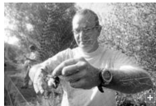
Uno de los miembros de Cigüeña Negra retira con cuidado una de las aves atrapadas para el control.

El Parque del Torrejón, junto a las marismas del Palmones, se convirtió ayer de nuevo en el escenario adecuado para mostrar actuaciones enmarcadas en la educación medioambiental. Este enclave natural sirvió para poner punto y final a toda una serie de actuaciones llevadas a cabo en diferentes jornadas por el colectivo ornitológico Cigüeña Negra, en colaboración con el Ayuntamiento de Algeciras con motivo de la celebración del Día Mundial de las Aves. El motivo central fue el anillamiento científico de aves.